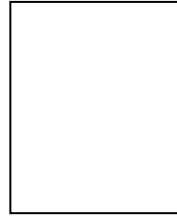
นักกีฬาหญิง