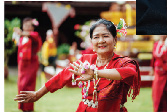
ลาวครั่ง