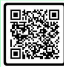
กิจกรรมล่องเรือ

ติดต่อสอบถามข้อมูลเพิ่มเติม สำนักงานการท่องเที่ยวและกีฬาจังหวัดชัยนาท โทร 056-412684