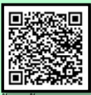
ข้อมูลร้านอาหาร (เพิ่มเติม)