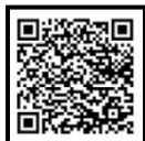
ข้อมูลร้านอาหาร (เพิ่มเติม)

15.30 น. ปิดท้ายทริปนี้กันที่ โรงพักเก่าสรรพยา แหล่งท่องเที่ยวทางประวัติศาสตร์ เป็นอาคารโรงพักของตำรวจสมัยรัชกาลที่ 5 มีอายุกว่า 100 ปี เก้าแก่ที่สุดในประเทศ และหากมาท่องเที่ยวในช่วง เสาร์-อาทิตย์ ต้นเดือน จะสามารถเที่ยวชมตลาดโรงพักเก่าสรรพยา จำหน่ายอาหารพื้นถิ่น เช่น ข้าวเกรียบลอยน้ำ ขนมอิกวาย บะหมี่แต้จิ๋ว และเน้นใช้ภาชนะจากวัสดุธรรมชาติ