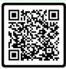
ที่พัก ในชัยนาท